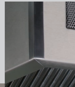
Ecke – Schliffkante