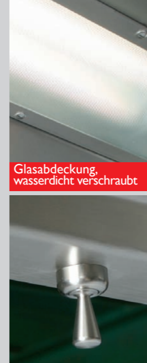
Glasabdeckung, wasserdicht verschraubt