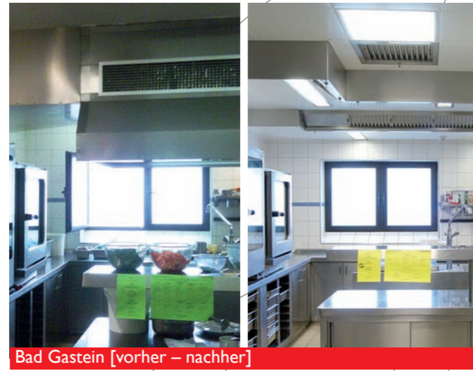
Bad Gastein [vorher – nachher]