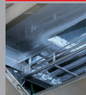
UV-C Ozon Luftreinigung, Kaltverbrennung